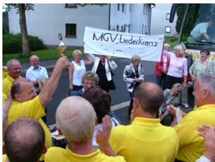
Es ging hoch her in Morsbach. Der Fan-Club stiftete sogar einen Pokal zum Volkslieder-Festival!

Leistungssingen und durch ein gelungenes Frühlingskonzert im Karl-Immer-Haus am 17.06.2007 konnten vier neue aktive Mitglieder gewonnen werden.