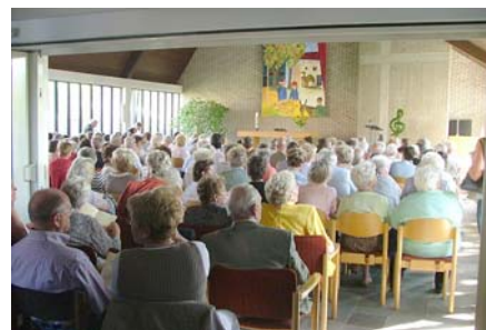
Wegen des großen Andrangs musste selbst der Vorraum im Karl-Immer-Haus noch bestuhlt werden.

Für die freundliche Bereitstellung des Gotteshauses sei an dieser Stelle Herrn Pfarrer Karl Hesse und der evangelischen Gemeinde nochmals herzlich gedankt.